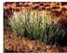
キャンデリラワックス