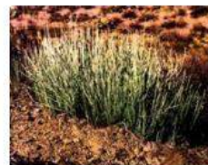
キャンデリラワックス