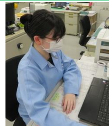
管理部 業務課 E・K さん 2021年度卒 (2022年度入)

08:00 出勤・朝礼 08:10 事務業務 | 10:00 社服在庫確認 | 12:00 昼休憩 12:50 経理業務 | 15:00 経理業務 | 16:50 退社