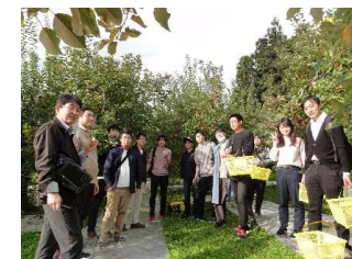
(奥久慈郡大子町・りんご狩り)