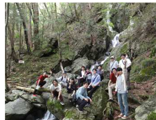
(花園溪谷・七つ滝)