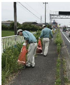
国道6号線沿いのゴミ拾い

★また、近隣の高等学校等のインターンシップの受入も積極的に行っており、工場実習を体験して頂いております。