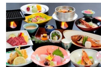
ご宿泊の お食事の一例

横山大観の別荘を移築した特別室がある、 宿泊施設をはじめ、 別館に併設されているレストラン椿は 現在土日祝昼間のみ お食事処として営業しております。 また太平洋を望む温泉、大観の湯は 平日10:00~15:00まで日帰りの方も ご利用いただける施設となっております。