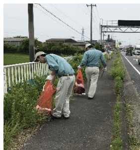
国道6号線沿いのゴミ拾い

★また、近隣の高等学校等のインターンシップの受入も積極的に行っており、工場実習を体験して頂いております。