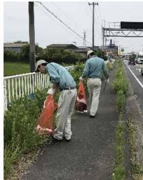
国道6号線沿いのゴミ拾い

★また、近隣の高等学校等のインターンシップの受入も積極的に行っており、工場実習を体験して頂いております。