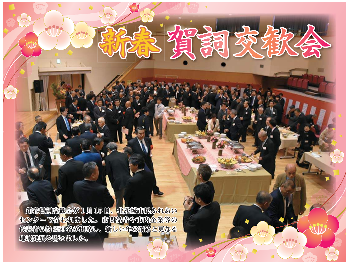
新春賀詞交歓会が1月15日、北茨城市民ふれあいセンターで行われました。市関係者や市内企業等の代表者ら約250名が出席し、新しい年の飛躍と更なる地域発展を誓いました。

■発行日/令和2年2月1日 第91号 商工会員数/986名 青年部員数/23名 女性部員数/104名