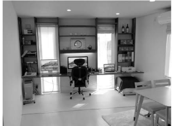
※会員事業所でPR希望がありましたら、事務局までご連絡下さい。

小社はこの地域に密着した「カスタマー・インテリマシー（顧客との親密さ）」を追求し、最良の結果を提供できるようサービスの研鑽に努めてまいります。