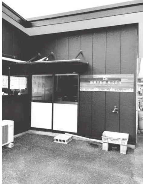
※会員事業所でPR希望がありましたら、事務局までご連絡下さい。