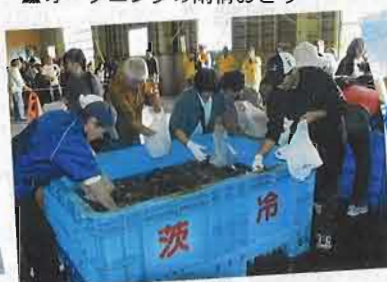
▲さんまのつかみどり