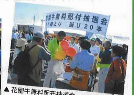
▲花園牛無料配布抽選会