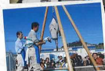
▲あんこうの吊るし切り